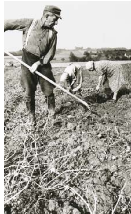
Früher wurden die Knollen von Hand ausgestochen und gesammelt.

Während früher für den Anbau, die Pflege und die Ernte eines Hektars Kartoffelfeld noch 320 Arbeitsstunden nötig waren, reichen heute nur 25 Stunden – und das bei einer etwa doppelten Erntemenge an Kartoffeln je Fläche. Landtechnik, Anbaumethoden und Erträge entwickeln sich auch zukünftig in enger Abhängigkeit stetig weiter.