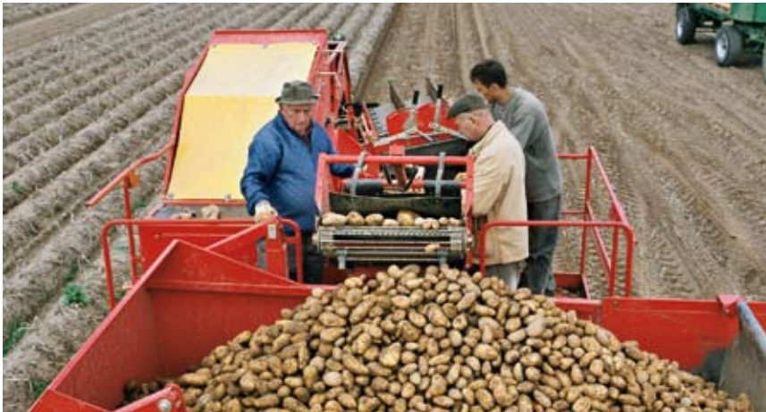
Heute stehen die Erntehelfer auf dem Vollernter und sortieren die maschinell geernteten Kartoffeln.

her Flächenleistung zur Verfügung. Das Pflanzen der Saatkartoffeln erfolgt durch mehrreihige Kartoffelpflanzmaschinen: Federzinken vorne an der Maschine lockern den Boden auf, dahinterfolgende Schare ziehen eine tiefe Furche. Ein Becherband nimmt die Pflanzkartoffeln aus dem großen Vorratsbehälter einzeln auf und legt sie in regelmäßigen Abständen von ca. 35 Zentimeter in die Pflanzfurche ab. Anschließend bedecken die schräg laufenden Sechsscheiben die abgelegten Pflanzkartoffeln mit reichlich Erde. Die so entstehenden Dämme bieten genügend Raum für das Wachstum neuer Kartoffelknollen und unterstützen eine optimale Versorgung mit Luft, Wärme und Wasser. Auch die Pflege der gedeihenden Pflanzen erfolgt heutzutage mit Maschinen: Das Hacken der Kartoffeln erfolgt mit einer mehrreihigen Hackmaschine, die von einem Traktor gezogen wird. Gegen Schädlinge und Krankheiten stehen zahlreiche chemische und biologische Pflanzenschutzmittel und Verfahren zur Verfügung. Wenn das Kartoffelkraut abgestorben ist und die Kartoffelknollen eine feste Schale gebildet haben und damit lagerfähig sind, kann schließlich geerntet werden.