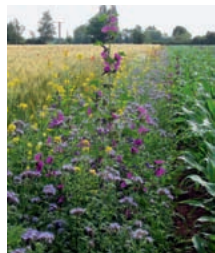
Blühstreifen zwischen zwei Getreidefeldern

Zum Abschluss können die SchülerInnen eine Bienenweide anlegen oder eine Kampagne für Bienenweiden starten (siehe S. 27/28).