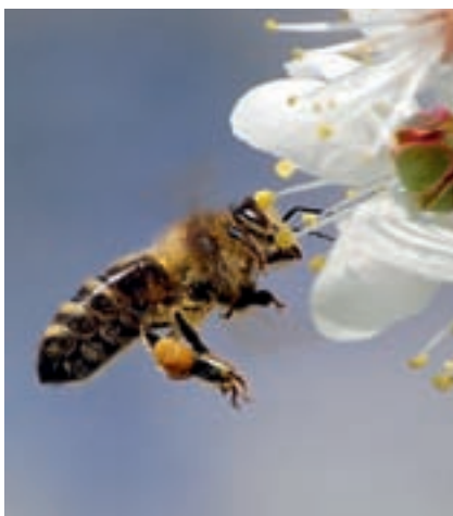
Gut gefülltes Pollenhöschen einer Sammelbiene

Während des Nektartrinkens berührt die Biene immer wieder die Staubgefäße der Blüte. Dabei bleiben viele Pollen in der Körper- und Beinbehaarung hängen. Die eiweißreichen Pollen werden in die „Körbchen“ an den Hinterbeinen