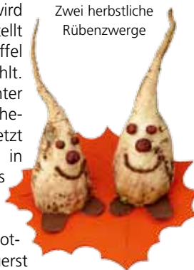
Zwei herbstliche Rübenzwerge

Zum Basteln der Lichter wird die Rübe erst oben und unten gerade abgeschnitten. Sie wird auf den Kopf gestellt und sauber mit Löffel und Messer ausgehöhlt. Dann werden Gesichter oder Verzierungen hereingeschnitzt. Zuletzt kommt ein Teelicht in die Rübe. Für das Basteln der Rübenlichter ist handwerkliches Geschick notwendig. Üben Sie zuerst mit den Kindern dem Umgang mit dem Messer, damit sich niemand verletzt. Zum Abschluss erleuchten die Lichter das Klassenzimmer. Dazu wird gemeinsam die Geschichte „Das schönste Lichtgesicht“ von Arbeitsblatt 2 gelesen und eine Bildergeschichte gemalt.