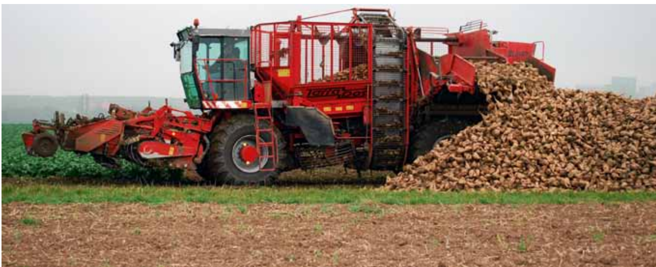
Der Rübenroder legt die geernteten Zuckerrüben am Feldrand ab.