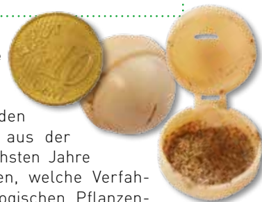
Kugel aus Stärke mit Eiern von Schlupfwespen

zen schonenden Ausbringung aus der Luft. Die nächsten Jahre werden zeigen, welche Verfahren des biologischen Pflanzenschutzes und der Landwirtschaft sich sonst noch mit Multikoptern optimieren lassen.