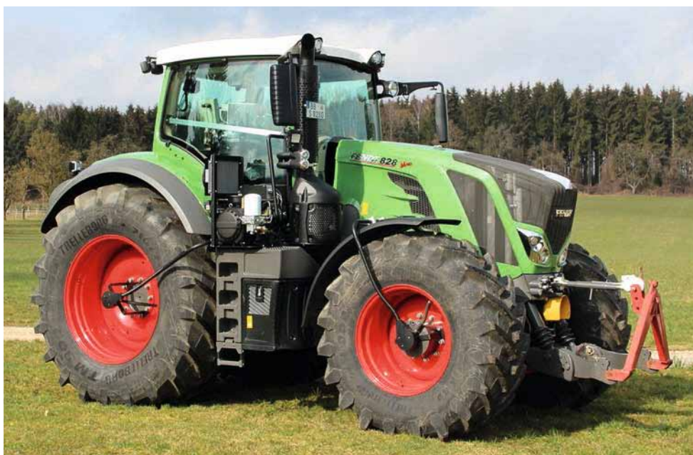
Moderne Traktoren können den Reifendruck elektrisch steuern bzw. regeln und zur Bodenschonung anpassen.

Arbeitsblatt 1 vermittelt die wichtigsten Bauteile eines Schleppers, hier mit Frontlader, sprich mit Schaufel zum Heben und Verladen oder Transportieren von Material. Die Sammelkarte (S. 17/18) liefert ein einfaches Experiment zur Hubkraft. Arbeitsblatt 2 zeigt viele weitere Einsatzgebiete und Traktormodelle. Die Kinder sollen selbstständig die Bilder mit den Textkästen verbinden und ggf. beschreiben, was sie auf den Fotos sehen. Wenn Sie mit der Klasse die Unterschiede der Modelle weiter vertiefen möchten, leihen Sie den SchülerInnen mehrere Traktor-Quartetts zum Spielen aus. So lernen sie nebenbei technische Einheiten wie PS bzw. kW und Tonnen besser kennen.