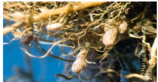
Wurzelknöllchen am Rotklee

„Knöllchenbakterien“ waren die Mikrobe des Jahres 2015, der wissenschaftliche Name Rhizobium bedeutet „in den Wurzeln lebend“. Vor schätzungsweise 100 Millionen Jahren entwickelte sich diese faszinierende Symbiose. Alle Hülsenfrüchtler – zu denen außer Bohne, Erbse, Kichererbse und Erdnuss noch rund 18.000 Arten zählen – können so auf stickstoffarmen Böden wachsen.