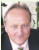
Joachim Rukwied, Präsident des Landesbauernverbandes in Baden-Württemberg e.V. (stellvertretender Vorsitzender)