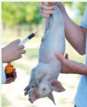
Die fachmännische Injektion erfolgt in die Kniefalte.

Dabei berücksichtigt er betriebsspezifische Faktoren, wie Alter und Immunstatus der