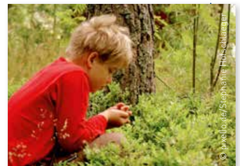
Beim Sammeln sind Regeln zum Schutz der Gesundheit und der Natur zu beachten.

Besonders im Sommer laden auch in freier Natur viele leckere Beeren zum Naschen ein. Man sollte allerdings nur Früchte sammeln, die bekannt sind – wie Walderdbeeren oder wilde Brombeeren – und die auch wirklich reif sind. Beim geringsten Zweifel sollte man die Früchte an den Pflanzen lassen oder Bestimmungsbücher zurate ziehen. Der Verzehr bspw. Roter Vogelbeeren bewirkt Magen- und Darmbeschwerden. Auch der Sammelort ist wichtig: Das Pflücken in Schutzgebieten ist verboten. Generell sollte man behutsam mit den Pflanzen umgehen. Zweige und Ranken dürfen nicht abgebrochen und niedrige Sträucher nicht zertreten werden. Beeren an Straßenrändern können mit schädlichen Stoffen belastet sein. Auch Infektionen sind über Wildfrüchte möglich, doch selten. Die Zahl der an Fuchsbandwurm erkrankten Menschen belief sich 2015 auf deutschlandweit 15 Fälle. Am besten die Früchte vor dem Verzehr waschen!