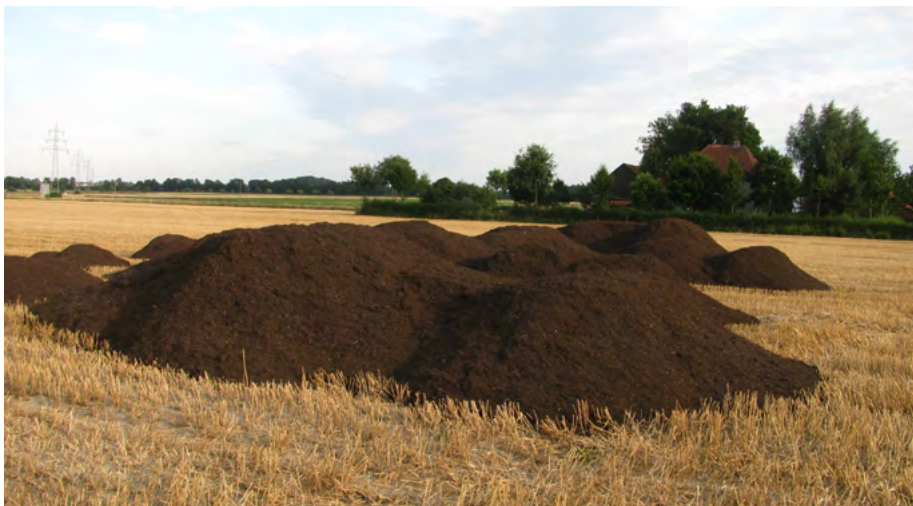
Komposte werden bevorzugt nach der Getreideernte ausgebracht. Bis auf wenige Monate im Jahr ist die Kompostausbringung ganzjährig möglich.

CO 2 -Emissionen weitgehend kompensieren, auch wenn Anreicherung und Speicherkapazität von Natur aus zeitlich und mengenmäßig begrenzt sind. Das 4‰-Ziel ist optimistisch, aber erreichbar – der Weg dorthin noch weit.